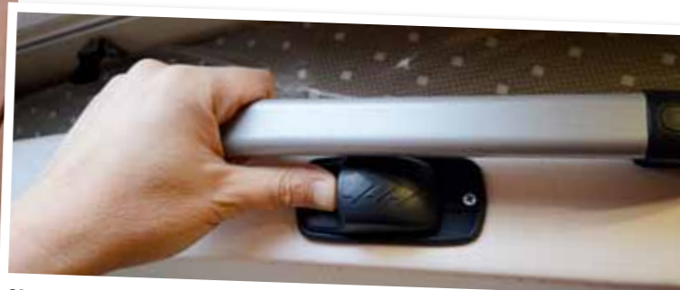
NOSTOVUOTEEN TOIMINTA ansaitsee ison plussan. Mekanismi on yksinkertainen: lukitusta siirretään oikealle ja sen jälkeen vedetään kevyesti kahvasta alas.

Suihkutilan syvyys on mukavat 76 senttiä, ja koska kyseessä on nostovuoteella varustettu kori, myös korkeutta riittää (198 cm). Muoviset suihkuseinät tukeutuvat osin lattian puurutilään, eivätkä ne helise ajattaessa.