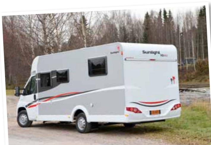
SUNLIGHTIN uusi takavalopaketti tuo auton 2010-luvulle.

JUHLAMALLI. Sunlight juhlii tulevalla caravan-kaudella 10-vuotista taivaltaan. Sen kunniaksi asiakkaille tarjotaan 10 Years Edition -erikoismalli kahdesta pohjaratkaisusta. Camper ajoi erillisuoteisen T68-mallin Muhoksen maisemissa.