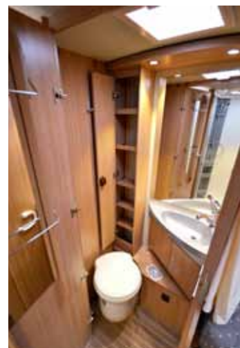
VESSASSA huomio kiinnittyi kulman korkeaan kaappiin, johon mahtuu paljon tavaraa yhden oven taakse.