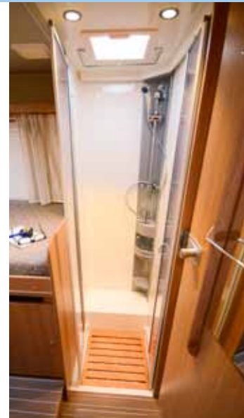
SUIHKUTILA on muutoin pätevä, mutta leveyttä sopisi olla hieman enemmän.

Normaalisti edullisemmat matkailuautot pitävät ajettaessa erilaista pienempää tai isompaa nitinää, natinaa ja kolinaa, etenkin tyhjällä kuormalla. Sunlight on kuitenkin positiivinen poikkeus. Kori ei varsinaisesti pidä minkäänlaista häiritsevää ääntä. ☺