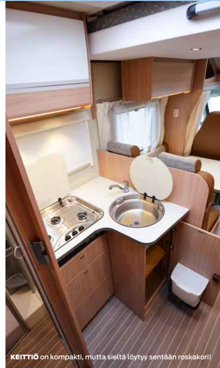
KEITTIÖ on kompakti, mutta sieltä löytyy sentään roskakori!