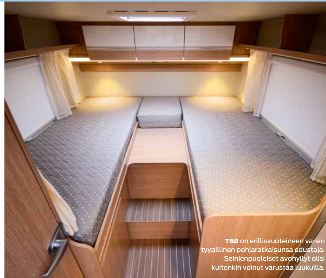
T68 on erillisvuoteineen varsin tyypillinen pohjaratkaisunsa edustaja. Seinienpuoleiset avohyllyt olisi kuitenkin voinut varustaa luukuilla.