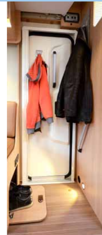
ETEINEN on esimerkillinen. Kengät saa sivuistuimen alle ja vaatteet useampaankin naulakkoon.