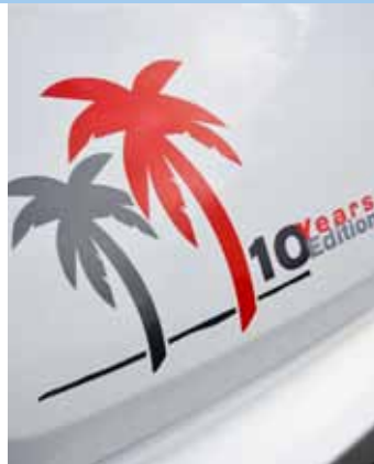
TÄSTÄ TUNNISTAA. Palmut ovat saaneet seurakseen merkinnästä kertovan tarroituksen.

Piirros perustuu valmistajan tietoihin, eikä ole mittakaavan mukainen. Lisävarusteet suluissa.