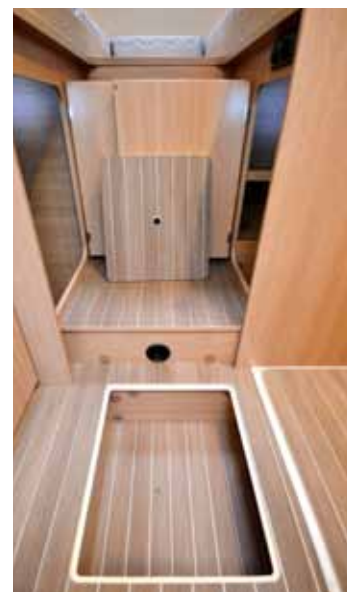
KESKELLÄ , vessan ja suihkun välissä, on pieni kaksoispohjalokero.