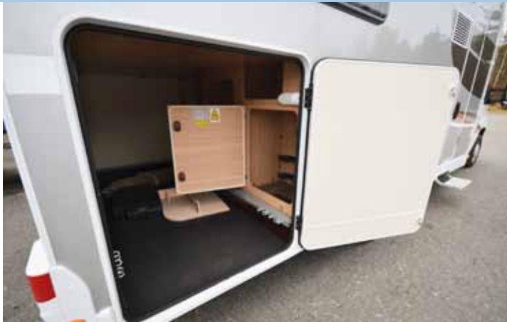
TAKATALLIN oven vapaat mitat ovat 94x110 senttiä. Tallin etuosassa on myös runsaasti säilytystilaa sekä kaasupullojen kotelo.

Kun nostovuode on ylhäällä, olohuoneeseen jää mukavat 191 senttiä kulkutilaa. Varsinaisen pääsohvan istuin on kovahko, mutta se lienee ainakin pidemmällä matkoilla enemmän positiivinen asia. Lisävarustelistalta kauppias oli ruksannut vuoteen-