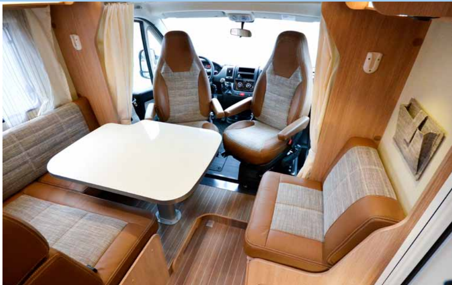
AITOA NAHKAA. Istuinosan reunoissa oleva materiaali on aitoa nahkaa ja se kuuluu juuri 10-vuotisjuhlapakettiin.